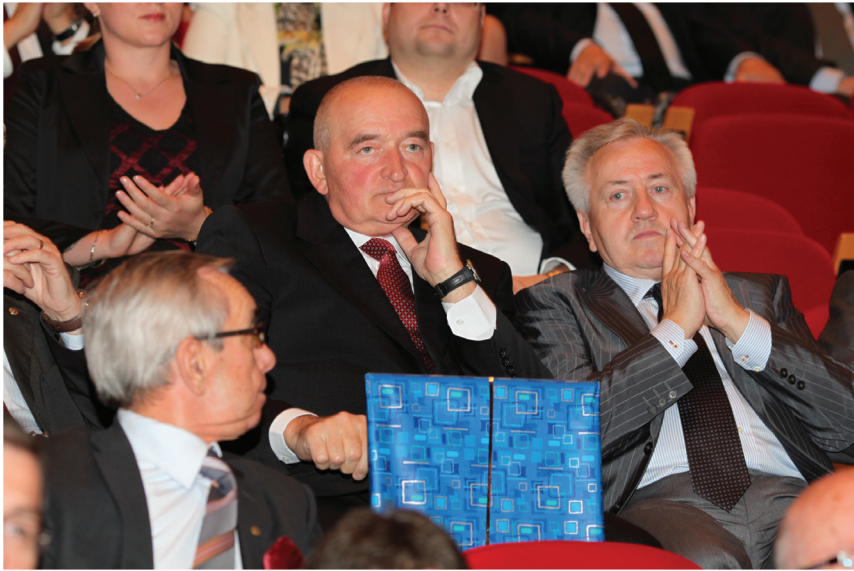
Jubileusz jubileuszem, a prezentu dla jubilatki ktoś musi pilnować