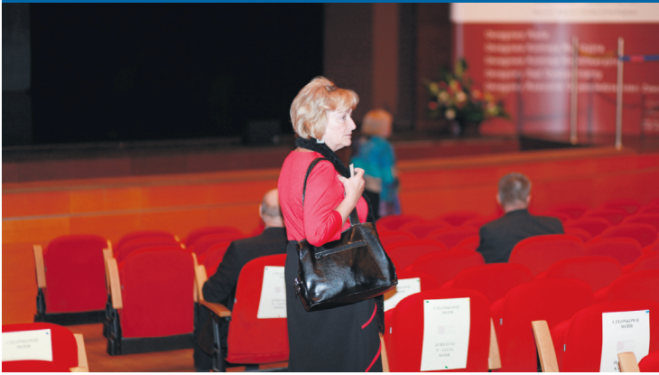
Gdzie tu usiąść skoro wszystkie miejsca zarezerwowane... dla nas