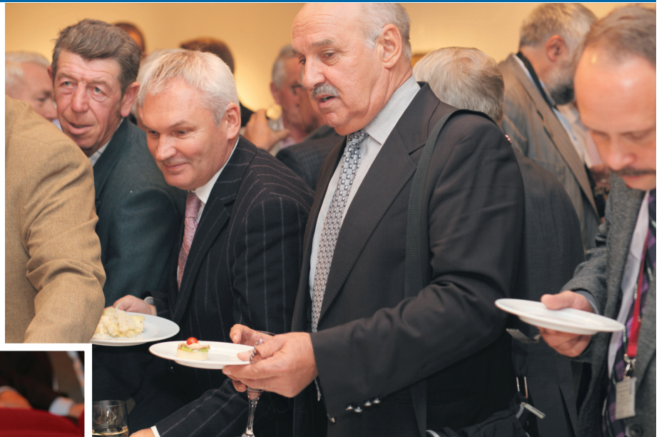
Grupa inżynierów budownictwa odegrała niechcący scenkę: „Jak działa w praktyce Prawo Zamówień Publicznych”